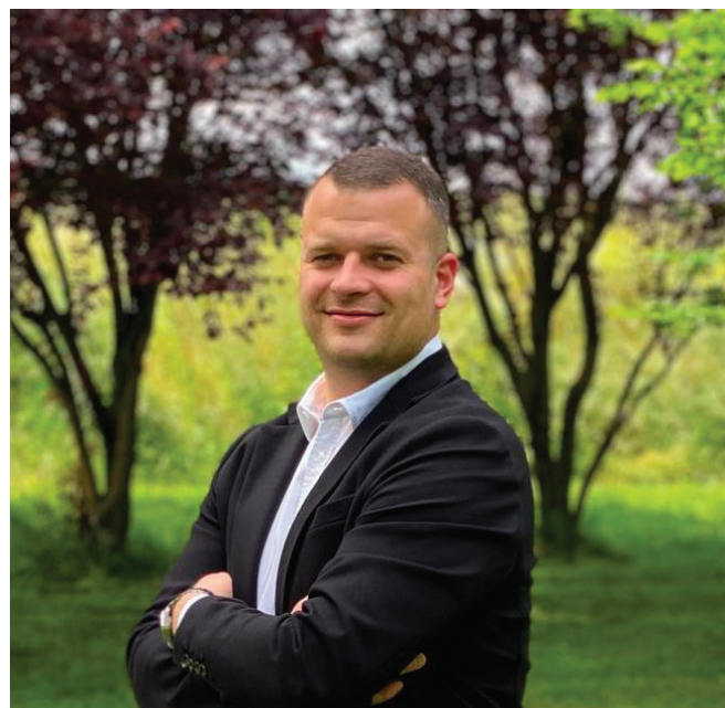
Il Sindaco di Rio Saliceto Daniele Pietri

Abbiamo voluto inoltre confermare una consuetudine che riteniamo particolarmente significativa: le ultime pagine del giornalino sono dedicate alle immagini delle tante attività sportive riesi. Calcio, tennis, pallavolo, ginnastica ritmica, danza, taekwondo, sub e molto altro raccontano, attraverso le fotografie, una comunità viva, dinamica e capace di coinvolgere tutte le generazioni .