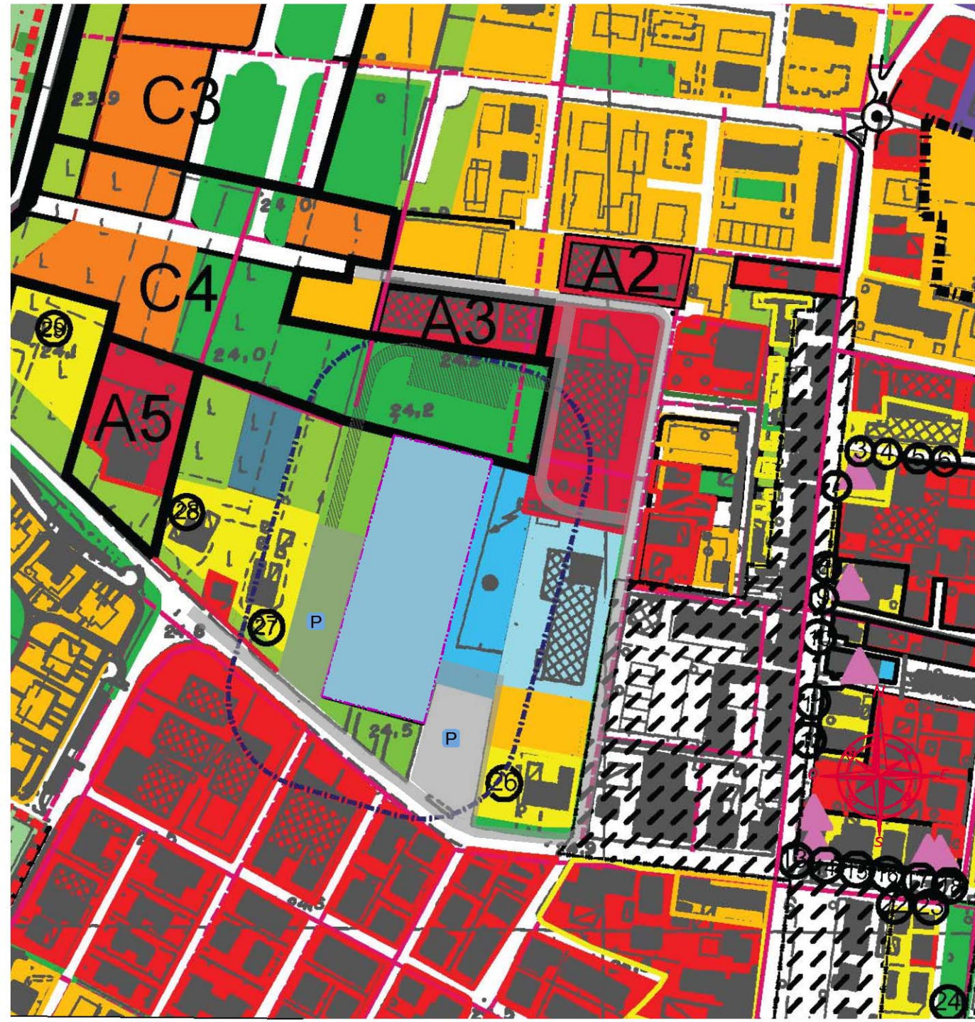
Rio Saliceto - fuori scala